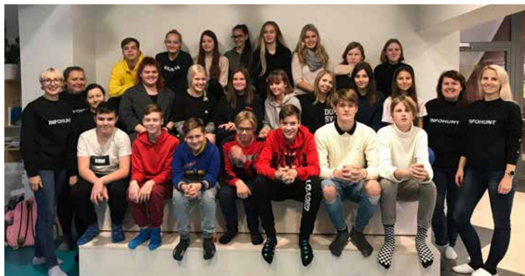
Infohundi loomine koos noortega Saaremaal.

Tegevusi rahastatakse haridus- ja teadusministri kinnitatud ning Haridus- ja Noorteameti poolt elluviidava Euroopa Sotsiaalfondist kaasrahastatud programmi „Tõrjutusriskis noorte kaasamine ja noorte tööhõivevalmiduse parandamine“ raames. •