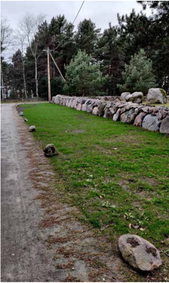
Pildil nähtav tegevus ei ole lubatud! Teemaa serva veeretatud kivid tuleb sealt kindlasti ära koristada. Lume tulekuga jäävad kivid lume alla varju ning võivad lõhkuda nii teeholdusmasina saha kui ka autosid.

Vahel on olnud probleeme sõidutee pervele või kergliiklusteele pargitud autodega, mis takistavad lume koristamist.