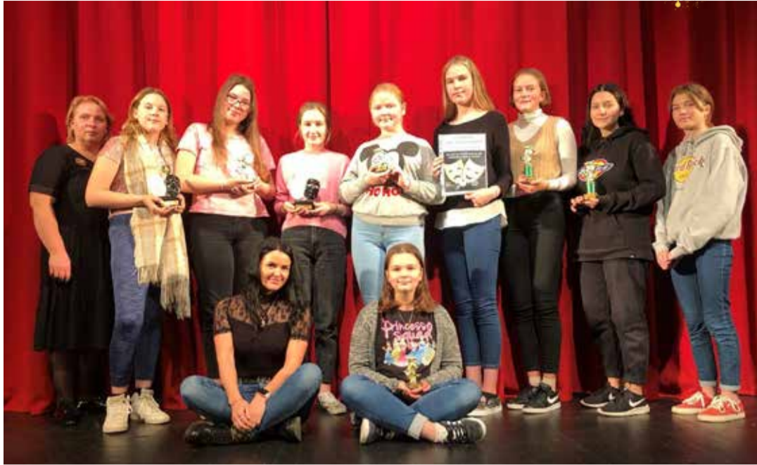
Nominent Kostivere Laste Teater.